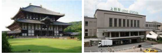
東大寺・大仏殿 東京・上野駅

平成29年度が始まって1月、忍中生は授業や部活動・委員会活動に熱心に取り組んでいます。さて、今月末には3年生の京都・奈良への修学旅行(5/31~6/2)、来月には2年生の上野方面への校外学習(6/1)が計画されています。現在両学年とも実行委員会を組織し、計画的に準備を進めています。(1年生は1月にスキー林間を予定しています)