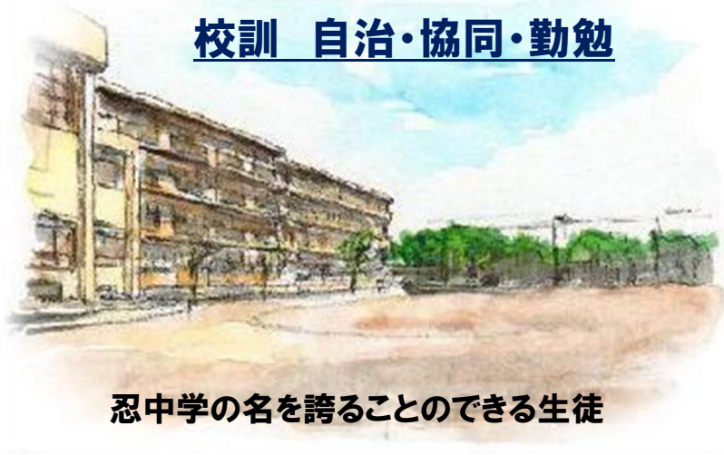
忍中学の名を誇ることでできる生徒